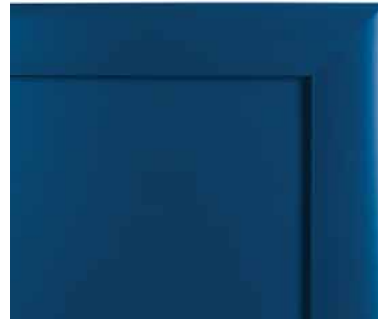
L40 - Laccato blu profondo L40 - Dark blue lacquered L40 - Laqué bleu profond L40 - Lackiert Dunkelblau