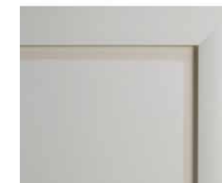
Anta contemporanea Contemporary door Porte contemporaine Zeitgenössische Tür

Le Tipologie di Traversi · Mid-section types · Les Types de Traverse · Auswahl der Querapplikationen