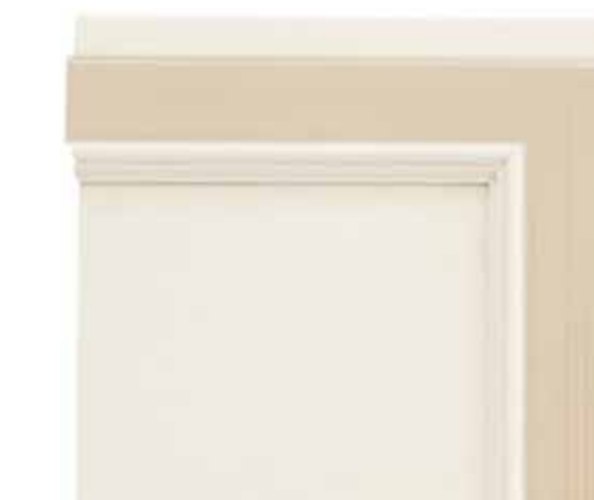
N08 - Bianco patinato sovracolori nocciola N08 - Glazed white with hazel-brown colour wash N08 - Blanc patiné avec badigeon noisette N08 - Weiß patiniert mit Deckfarbe Haselnuss