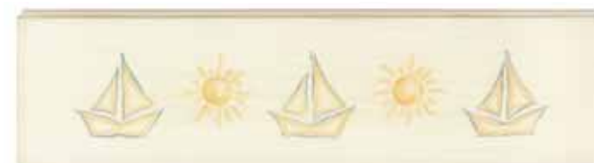
Decoro tipo "C" barchette · Decoration "C", boats Décor de type "C" petits bateaux · Verzierung typ "C": boote