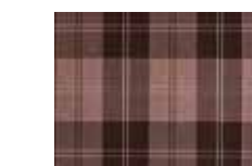
Applicazione carta parati Wallpaper application Application papier peint Applikation Wandtapete

In aggiunta alla tradizionale cornice per ante e cassetti dal profilo classico che ben si presta ad eventuali sovracolori, è stata introdotta un nuovo tipo di cornice dal profilo più semplice dal gusto più contemporaneo. Ogni tipologia di anta può essere ulteriormente arricchita con traversi o applicazioni per rendere veramente unica ogni proposta.