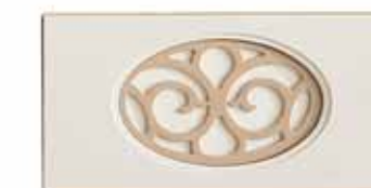
Traverso traforato Fretwork mid-section Traverse percée Querapplikation mit durchbrochener Verzierung

Le Tipologie di Applicazioni · Types of Application · Les Types d'Applications · Auswahl der Applikationen