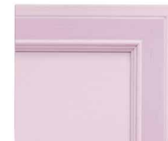
H66 - Lilla patinato sovracolori in tinta H66 - Lilac glazed finish with matching colour wash H66 - Lilas patiné avec badigeon assorti H66 - Lila patiniert deckfarbe im gleichen ton