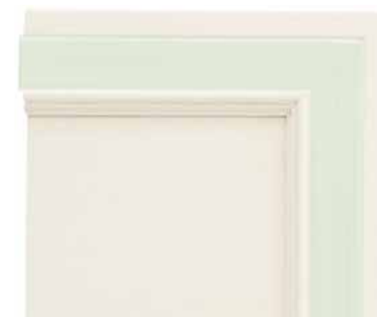
N01 - Bianco patinato sovracolori verde N01 - Glazed white with green colour wash N01 - Blanc patiné avec badigeon vert N01 - Weiß patiniert mit Deckfarbe Grün

On réalise avec un pinceau sur un fond de base d'un ton blanc une patine très claire en ajoutant éventuellement un badigeon parmi les 9 propositions du catalogue. Über den Grundton Weiß wird mit dem Pinsel eine sehr helle Patina aufgetragen, evtl. kombinierbar mit einer der im Katalog vorgestellten neuen Deckfarben.