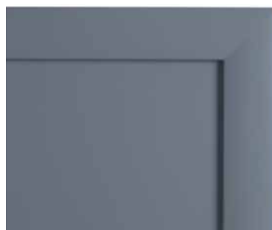
L45 - Laccato carta zucchero L45 - Mid blue lacquered L45 - Laqué papier de sucre L45 - Lackiert Zuckerpapier