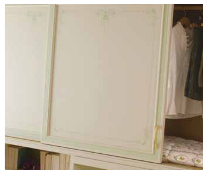
Decoro tipo "Q" riquadro Decoration "Q", on door panel Décor de type "Q" panneau de porte Verzierung typ "Q": umrandung