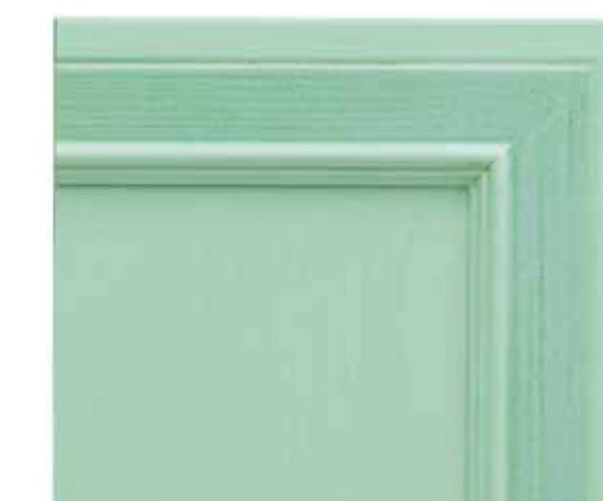
H77 - Latte e menta patinato sovracolori in tinta H77 - Milk and mint glazed finish with matching colour wash H77 - Lait et menthe avec badigeon assorti H77 - Minzeis patiniert deckfarbe im gleichen ton