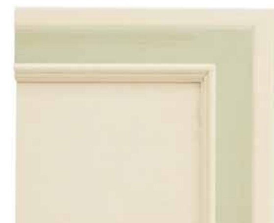
H01 - Patinato magnolia sovracolori verde H01 - Glazed magnolia finish with light green colour wash H01 - Patiné magnolia avec badigeon vert H01 - Magnolie patiniert mit deckfarbe grün

Für einen klassischeren Geschmack ist der Grundton „Creme“, und die mit dem Pinsel oder Schwamm aufgetragene Patina hat eine stärkere Färbung.