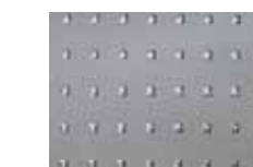
Applicazione "quadretto" "Chequered" application Application "carreau" Applikation "Kästchen"