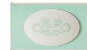
Traverso con ovalino Mid-section with decorative oval Traverse avec élément ovale Querapplikation mit oval