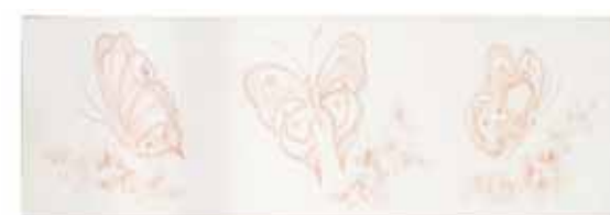
Decoro tipo "D" farfalle · Decoration "D", butterflies Décor de type "D" papillons · Verzierung typ "D": schmetterling