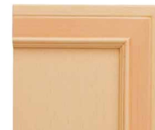
H55 - Arancio patinato sovracolori in tinta H55 - Orange glazed finish with matching colour wash H55 - Orange patiné avec badigeon assorti H55 - Orange patiniert deckfarbe im gleichen ton