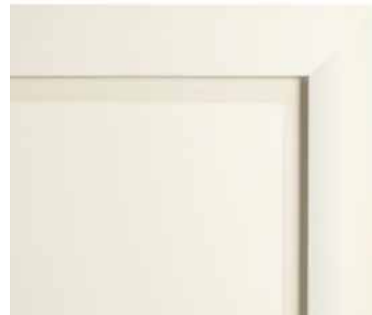
A62 - Laccato bianco antico A62 - Antique white lacquered A62 - Laqué vieux blanc A62 - Lackiert Weiß Antik