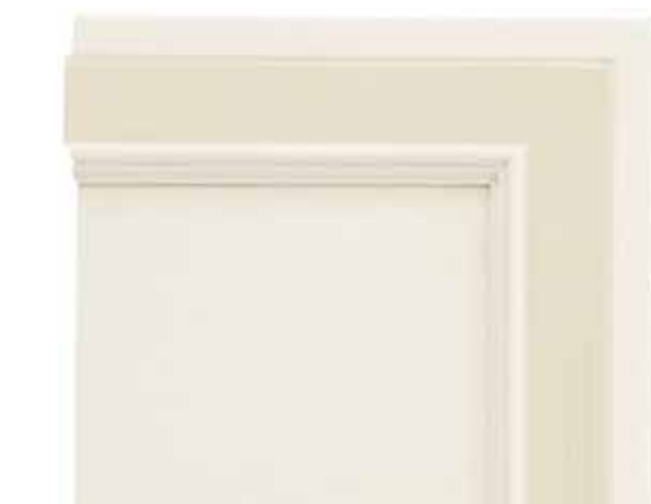
N09 - Bianco patinato sovracolori corda N09 - Glazed white with rope colour wash N09 - Blanc patiné avec badigeon corde N09 - Weiß patiniert Deckfarbe Kordel