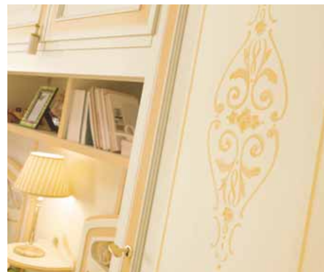
Decoro tipo "F" centrale Decoration "F", centered Décor de type "F" central Verzierung typ "F": zentral