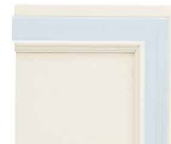
N02 - Bianco patinato sovracolori azzurro N02 - Glazed white with blue colour wash N02 - Blanc patiné avec badigeon bleu clair N02 - Weiß patiniert mit Deckfarbe Blau