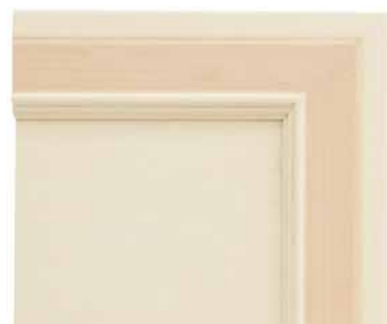
H03 - Patinato magnolia sovracolori rosa H03 - Glazed magnolia finish with pink colour wash H03 - Patiné magnolia avec badigeon rose H03 - Magnolie patiniert mit deckfarbe rosa