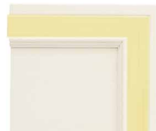
N04 - Bianco patinato sovracolori giallo N04 - Glazed white with yellow colour wash N04 - Blanc patiné avec badigeon jaune N04 - Weiß patiniert mit Deckfarbe Gelb