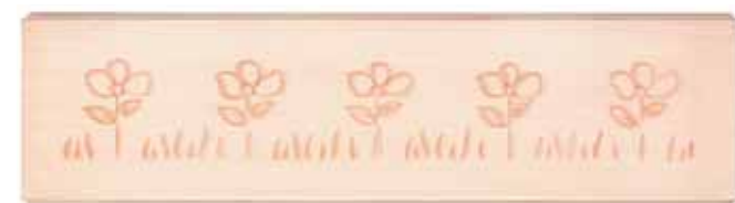
Decoro tipo "B" prato fiorito · Decoration "B", meadow flowers Décor de type "B" prairie fleurie · Verzierung typ "B": blumenwiese