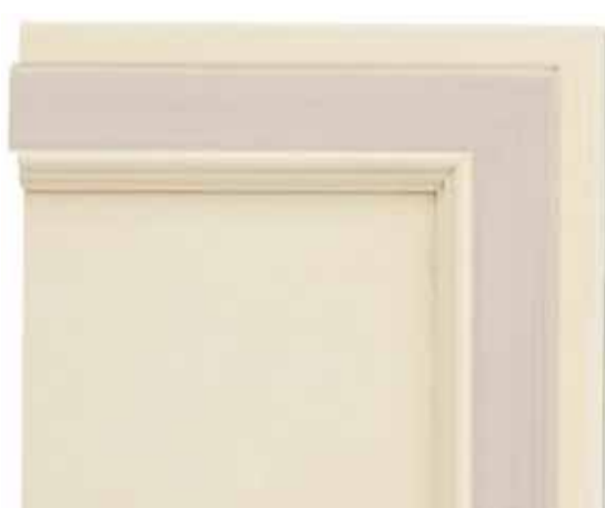
H06 - Patinato magnolia sovracolori lilla H06 - Glazed magnolia finish with lilac colour wash H06 - Patiné magnolia avec badigeon lilas H06 - TMagnolie patiniert mit deckfarbe lila