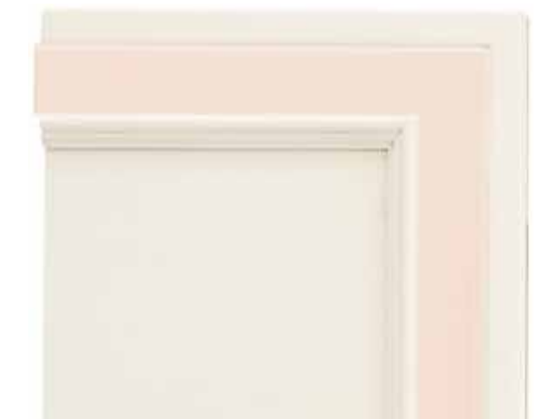
N03 - Bianco patinato sovracolori rosa N03 - Glazed white with pink colour wash N03 - Blanc patiné avec badigeon rose N03 - Weiß patiniert mit Deckfarbe Rosa