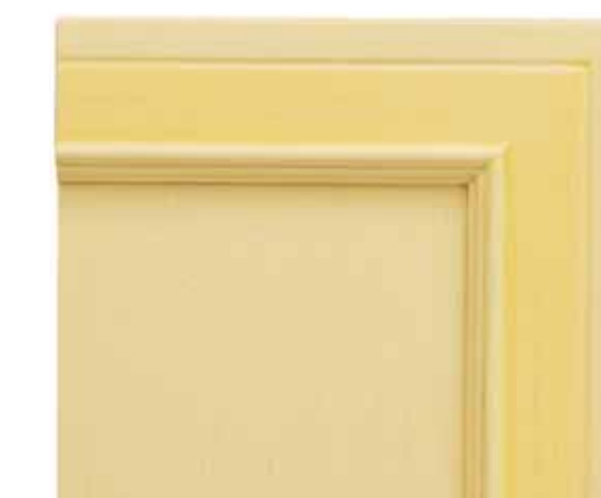
H44 - Giallo patinato sovracolori in tinta H44 - Yellow glazed finish with matching colour wash H44 - Jaune patiné avec badigeon assorti H44 - Gelb patiniert deckfarbe im gleichen ton