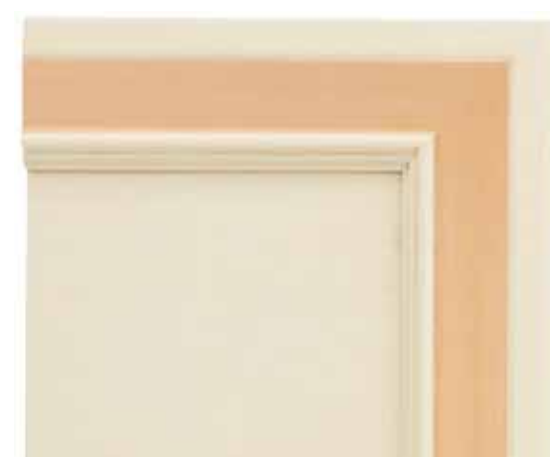
H05 - Patinato magnolia sovracolori arancio H05 - Glazed magnolia finish with orange colour wash H05 - Patiné magnolia avec badigeon orange H05 - Magnolie patiniert mit deckfarbe orange