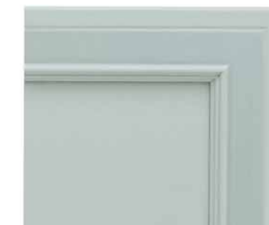
H22 - Azzurro patinato sovracolori in tinta H22 - Blue glazed finish with matching colour wash H22 - Bleu clair patiné avec badigeon assorti H22 - Blau patiniert deckfarbe im gleichen ton