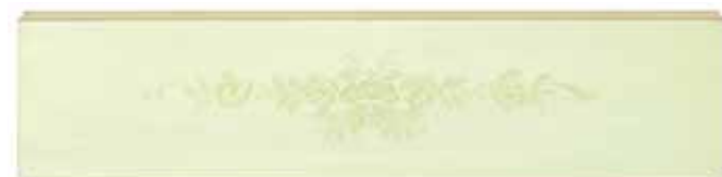
Decoro tipo "A" mazzolino di rose · Decoration "A", bouquet of roses Décor de type "A" petit bouquet de roses · Verzierung typ "A": rosensträußchen