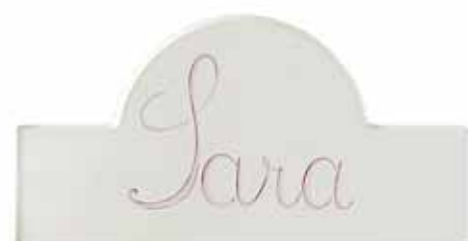
Decoro tipo "E" nome · Decoration "E", name Décor de type "E" nom · Verzierung typ "E": name