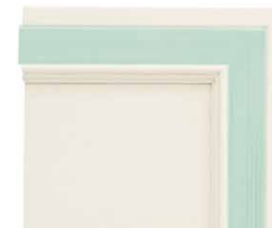
N07 - Bianco patinato sovracolori latte e menta N07 - Glazed white with milk and mint colour wash N07 - Blanc patiné avec badigeon lait et menthe N07 - Weiß patiniert mit Deckfarbe Minzeis