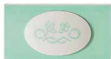
Decoro tipo "G" floreale · Decoration "G", floral Décor de type "G" floral · Verzierung typ "G": blumenmuster