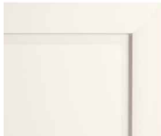
L01 - Laccato bianco opaco L01 - White matt lacquered L01 - Laqué blanc mat L01 - Matt lackiert Weiß

Die Lackierung ist in 9 Varianten möglich, ohne Verarbeitung mit Patina. Auf Wunsch stehen alle RAL-Farben zur Verfügung.