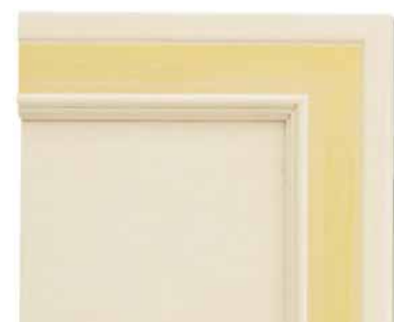
H04 - Patinato magnolia sovracolori giallo H04 - Glazed magnolia finish with yellow colour wash H04 - Patiné magnolia avec badigeon jaune H04 - Magnolie patiniert mit deckfarbe gelb