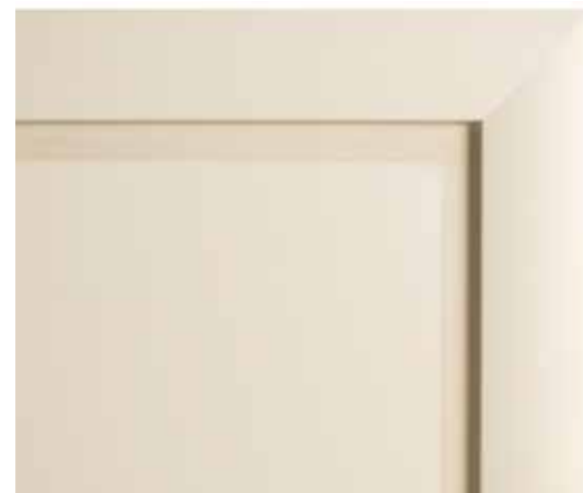
L70 - Laccato corda opaco L70 - Rope matt lacquered L70 - Laqué corde mat L70 - Matt lackiert Kordel