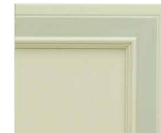
H11 - Verde patinato sovracolori in tinta H11 - Green glazed finish with matching colour wash H11 - Vert patiné avec badigeon assorti H11 - Grün patiniert deckfarbe im gleichen ton

Verfügbar in 7 Varianten. Der farbige Grundton wird anschließend mit Patina und eventuell mit gleichfarbigen Deckfarben bearbeitet.