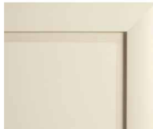
L30 - Laccato champagne opaco L30 - Champagne matt lacquered L30 - Laqué champagne mat L30 - Matt lackiert Champagner