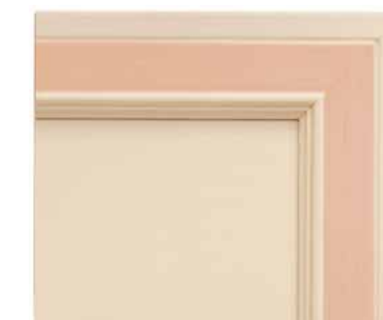
H33 - Rosa patinato sovracolori in tinta H33 - Pink glazed finish with matching colour wash H33 - Rose patiné avec badigeon assorti H33 - Rosa patiniert deckfarbe im gleichen ton