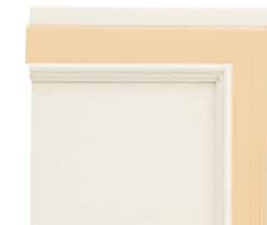
N05 - Bianco patinato sovracolori arancio N05 - Glazed white with orange colour wash N05 - Blanc patiné avec badigeon orange N05 - Weiß patiniert mit Deckfarbe Orange