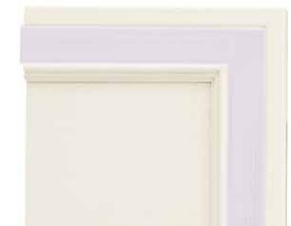
N06 - Bianco patinato sovracolori lilla N06 - Glazed white with lilac colour wash N06 - Blanc patiné avec badigeon lilas N06 - Weiß patiniert mit Deckfarbe Lila