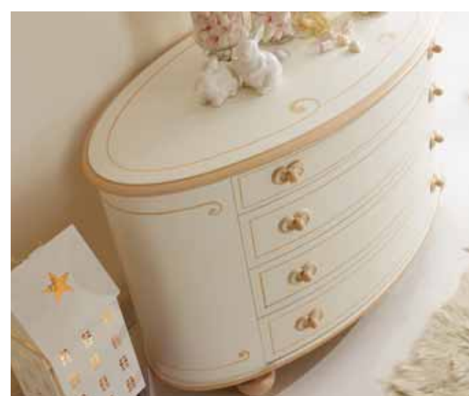
Decoro tipo "H" ricciolo Decoration "H", curlicue Décor de type "H" boucle Verzierung typ "H": lockenmuster

Tutti i decori sono realizzati interamente a mano accrescendo così il valore artigianale del ns. prodotto. In questo catalogo proponiamo diverse tipologie di decori, lasciando ovviamente la possibilità di decori a richiesta per soluzioni super personalizzate.