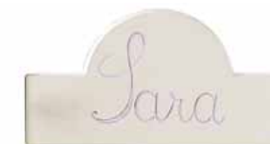
Traverso sagomato Decoratively shaped mid-section Traverse profilée Geformte Querapplikation