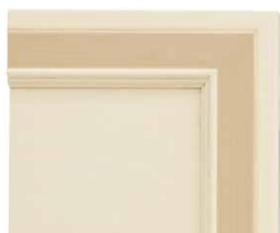
H08 - Patinato magnolia sovracolori nocciola H08 - Glazed magnolia finish with hazel-brown colour wash H08 - Patiné magnolia avec badigeon noisette H08 - Magnolie patiniert mit deckfarbe haselnuss

TIPO "B": Fondo colorato con sovracolori · TYPE "B": Colour base with colour wash · TYPE "B": Fond coloré avec badigeon · TYP "B": Farbiger Untergrund mit Deckfarbe