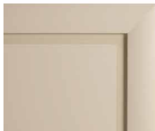
L80 - Laccato tortora opaco L80 - Dove-grey matt lacquered L80 - Laqué tourterelle mat L80 - Matt lackiert Taubengrau