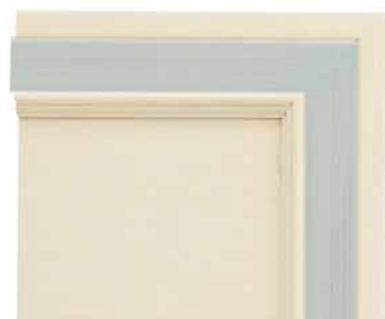
H02 - Patinato magnolia sovracolori azzurro H02 - Glazed magnolia finish with light blue colour wash H02 - Patiné magnolia avec badigeon bleu clair H02 - Magnolie patiniert mit deckfarbe blau