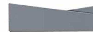
Traverso asimmetrico Asymmetric mid-section Traverse asymétrique Asymmetrische Querapplikation